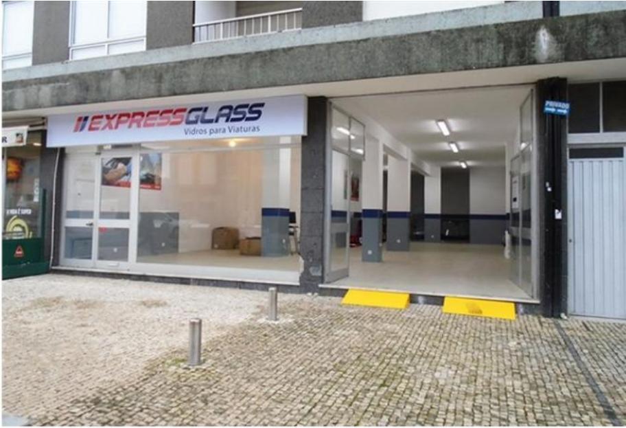
ExpressGlass - Santo Tirso

Criada em 2002, a empresa é detida atualmente pela sociedade de capital de risco Inter-Risco que comprou o Grupo ExpressGlass em junho de 2016. Sendo um dos líderes no negócio de reparação e substituição de vidros para viaturas, em veículos ligeiros, pesados e autocarros de passageiros, detendo a segunda maior rede de lojas a nível nacional, a ExpressGlass é a única com capital 100% português.