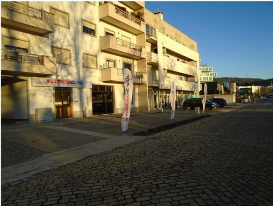
ExpressGlass - Viana do Castelo

De acordo com o plano de negócios definido para 2017, a empresa aposta no aumento da penetração da marca junto dos consumidores e no alargamento da rede em todo o país, quer com a abertura de novas lojas em locais estratégicos, quer melhorando permanentemente as localizações atuais.